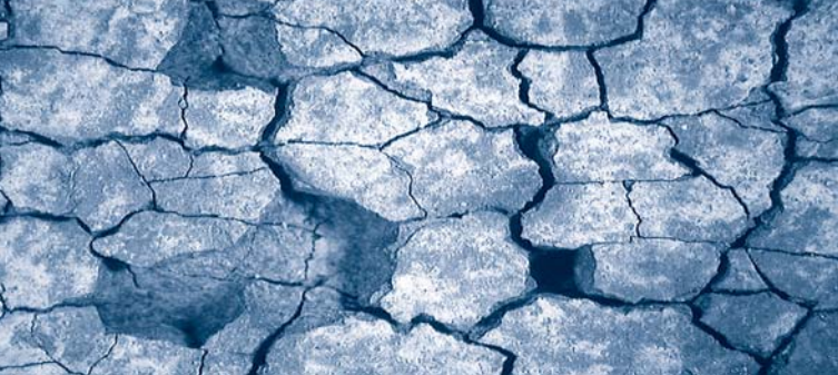
Rissige Korrosionsprodukte auf einer Stahloberfläche